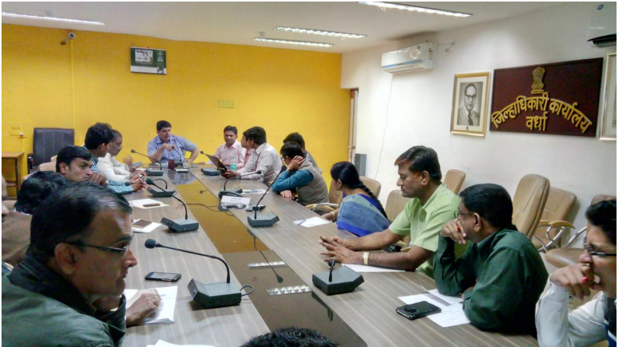
Meeting at District Collectorate, Wardha