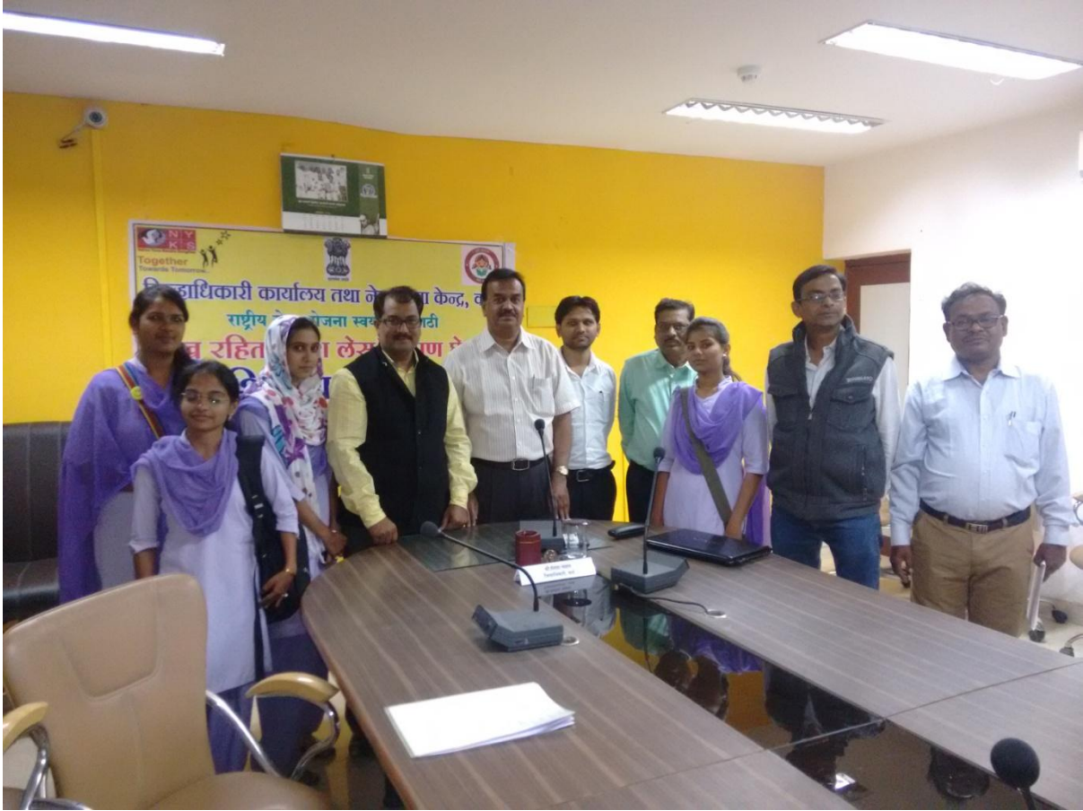
Dissemination of information regarding Vittiya Saksharta Bhiyan (VISAKA)