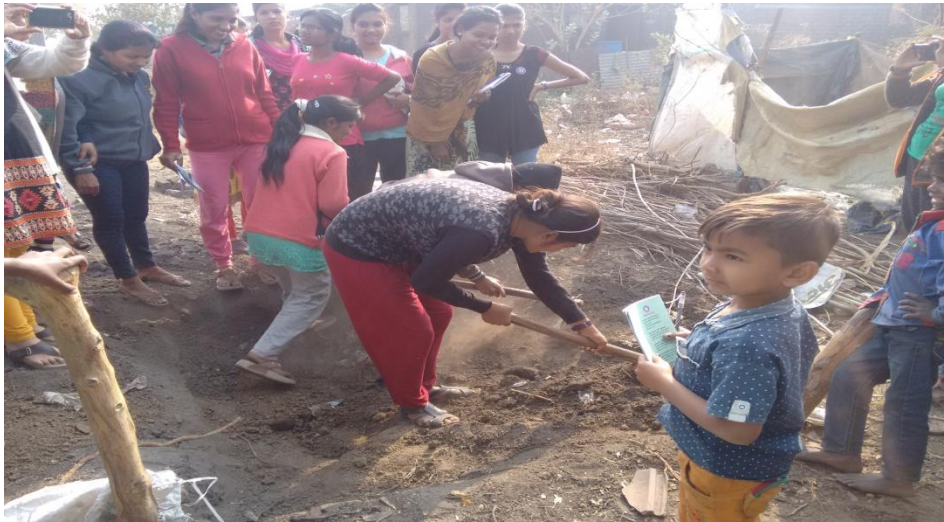
During Village Camp at Satoda, NSS volunteers digging pits for toilets